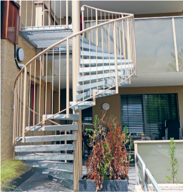
Die Spindeltreppen von Sprich werden objektbezogen, individuell, ihren Wünschen entsprechend gefertigt.

Spindeltreppen verbinden Stockwerke auf engstem Raum, sehen elegant aus, sind gleichzeitig platzsparend und kostengünstig. Die Ausführungsmöglichkeiten sind beinahe grenzenlos. Für eine Bäckerei in Inwil wurde eine Spindeltreppe im Aussenbereich von Sprich geplant und produziert.