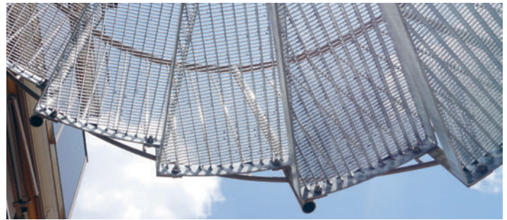
Die Treppenstufen sind feuerverzinkt, mit Gleitschutz ausgeführt und gewähren so ein sicheres Begehen bei allen Witterungsverhältnissen.

Um die Terrasse eines Altbaus mit einem Balkon und einer anderen Terrasse eines angebauten Neubaus in den oberen Stockwerken zu verbinden, wurde eine Spindeltreppe benötigt. Diese sollte an der Fassade der älteren Hauswand angebracht werden. Herausforderungen bei diesem Projekt waren die stabile Befestigung an der bröckelnden Fassade und der Übertritt des Spindeltreppenpodests auf die Balkone bzw. Terrassen.